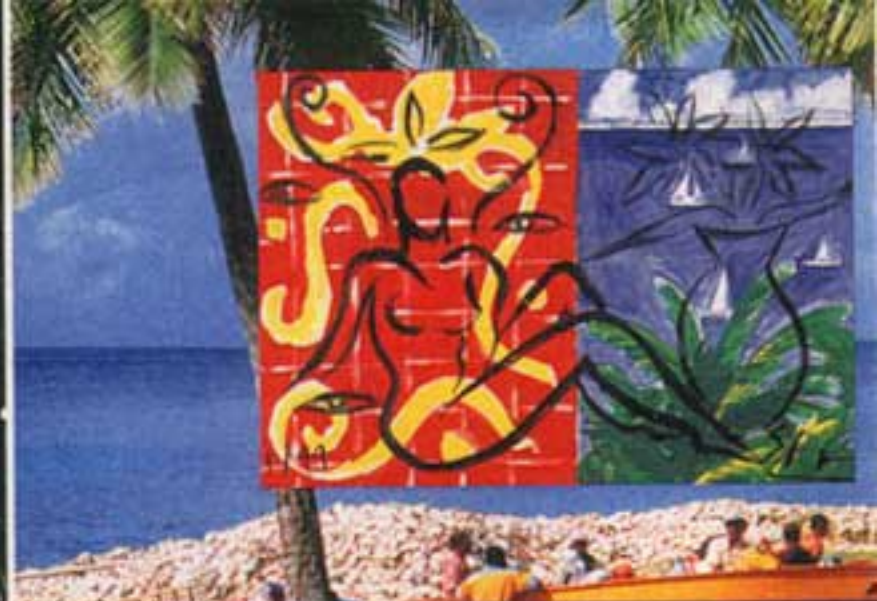
Mustique-Ansichten von Bräutigam Szczesny: farbenfroh und sinnlich wie die Insel selbst